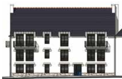
Façade rue Joliot Curie