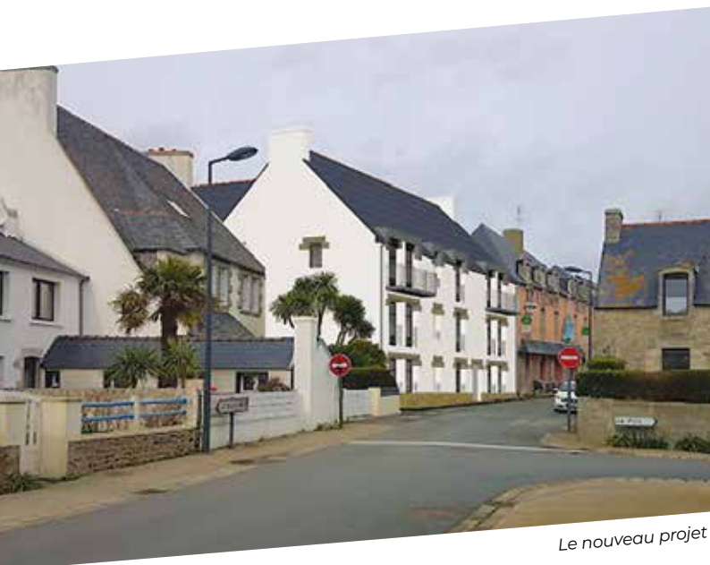
Le nouveau projet