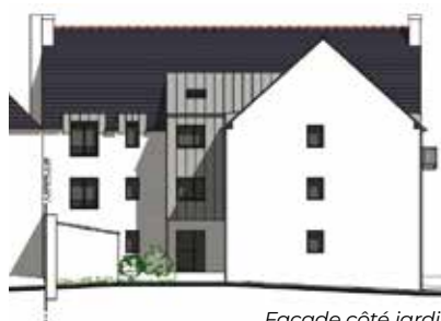
Façade côté jardin