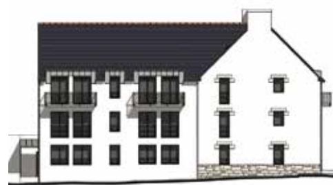
Façade côté ruelle

Avec un souci de fiabiliser cette opération et d'optimiser l'économie de l'opération, le projet a été réétudié dans l'optique de construire des logements neufs et de répartir la typologie entre T2 et T3.