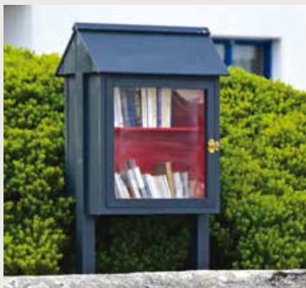
Une Boîte à Lire

Nos Boîtes à Lire ont élu domicile dans des lieux de passage de la commune : Place du 19 mars 1962 (Plobannaec) près du nouveau parc de jeux pour enfants, au Jardin de l'usine (Lesconil) près du banc, Plage des quatre vents (Lesconil).