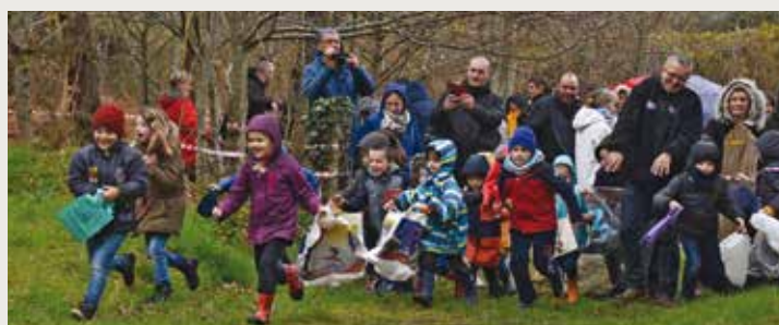
Départ sur les chapeaux de roue pour la chasse aux œufs

Plusieurs manifestations ont vu le jour : le Grand prix cycliste inter-régional en 1965, participation au Chupenn Bigouden, arrivée de la course des 40 clochers... entre autres. Le comité est actuellement présidé par Jean-Claude Billien.