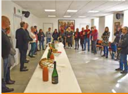
Pot de bienvenue des nouveaux habitants

Une quinzaine de nouvelles familles sont arrivées sur la commune. Elles sont aussi bien installées à Plobannaec qu'à Lesconil, dans les nouveaux quartiers que dans les hameaux. On ne vient pas par hasard ici : chacun a déjà eu une expérience avec la commune. Après une présentation des nouveaux habitants et de l'équipe municipale puis un développement des projets en cours (l'école Fleming, l'apaisement des vitesses, l'attention portée à la consommation énergétique...) des questions sur les sujets d'actualités, un verre de l'amitié a été partagé.