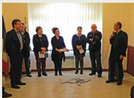
Remise de médaille à St-Jean-Trolimon