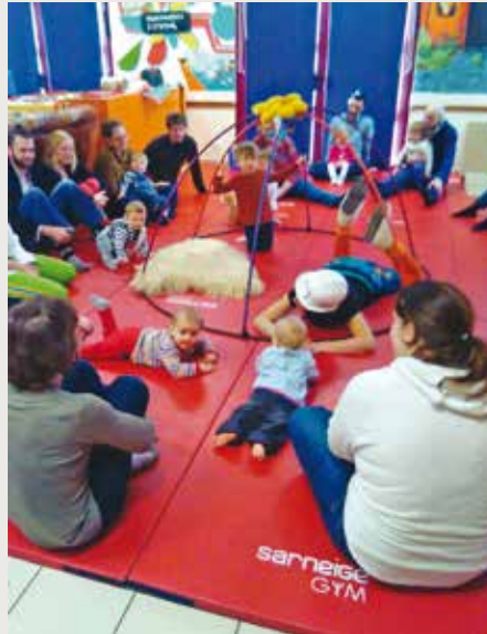
Petits mais déjà acteurs

La dixième édition des Semaines de la Petite Enfance en Finistère a eu lieu, entre mars et avril, grâce au travail collectif de la CAF, de la compagnie Très Tôt Théâtre, des différentes structures de la petite enfance, famille, culture et les communautés de communes. En Pays bigouden, divers ateliers autour de l'éveil corporel et sensoriel, la musique, les livres, les jeux ou encore la cuisine, le bricolage... étaient programmés durant 5 semaines sur tout le territoire. Sur notre commune, l'atelier « Musique et Imaginaire » animé par la compagnie Switch, a séduit une bonne dizaine de tout-petits et leurs parents. Chacun, passant du rôle de spectateur à celui d'acteur, a participé à la construction d'une cabane, le tout dans une ambiance riche de sonorités diverses. L'atelier rejoignait le spectacle « Moults Ronds » présenté par la même compagnie à la salle Cap Caval, le soir-même.