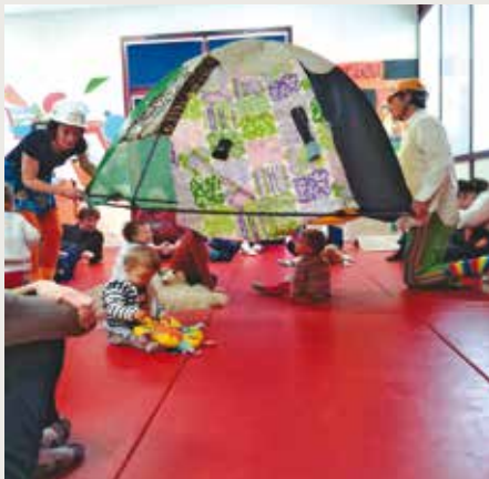
Une belle cabane créée ensemble