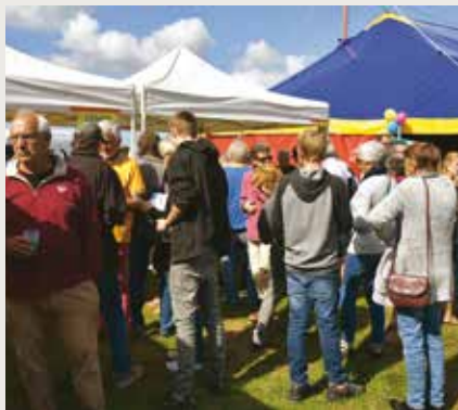
De nombreux visiteurs

Démonstrations, goûter des enfants, buvette, dictée collective, tir à la corde, jeux Bretons et le pique-nique partagé convivial du midi, étaient autant de possibilités de passer une agréable journée.