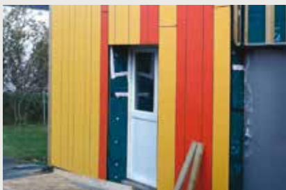
L'entrée de l'école maternelle

Comme prévu, tout a été mis en œuvre pour que les nuisances inhérentes à la