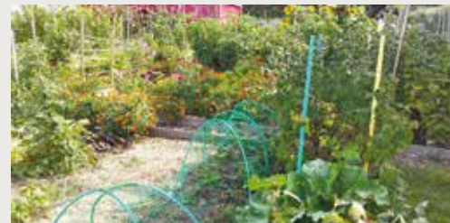
Les jardins partagés

Après l'inauguration des jardins partagés le 25 novembre 2017, le temps est venu pour les jardiniers de voler de leurs propres ailes. L'association « Des jardins partagés des Glénan » est maintenant créée pour gérer le fonctionnement interne, l'ensemble des jardins restant propriété de la Commune.