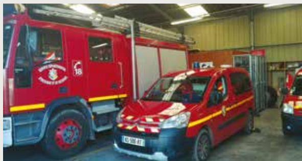
Les véhicules du centre de secours de PL

Merci aux maires de Loctudy et de Plobanna-