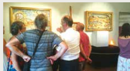
Les trésors de Youen Durand

Exposés cet été au manoir de Kerazan, les tableaux en coquillages de Youen Durand ont fasciné une fois encore un public nombreux. La collection, propriété de la commune, a été prêtée pour l'occasion à l'association des « Amis de Kerazan » avec le concours des « Amis de Youen Durand ». Pendant l'été 2020, chacun pourra contempler à nouveau ces trésors du patrimoine local au sémaphore de Plobannaec-Lesconil. D'ici là, rendez-vous sur le site dédié à l'artiste : youendurand.com.