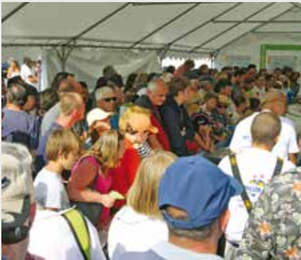
6000 repas vendus cette année

Les 300 bénévoles de Tout An Dud ont permis l'organisation d'une fête haute en couleurs : solidarité avec la SNSM, mise en